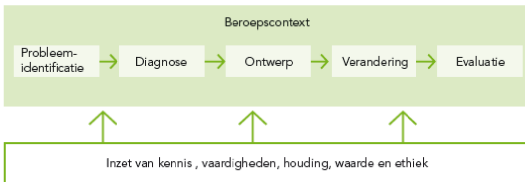
Figuur 1: Naar de competenties van de bedrijfskundige handelingscyclus (Landelijk Opleidingsoverleg Bedrijfskunde (LOO BK), 2018) 1

De taakcompetenties zijn afgeleid van de bedrijfskundige handelingscyclus :